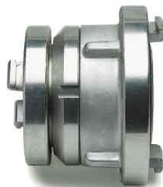
Übergangsstücke – Storz-Storz – Storz-Gasgewinde